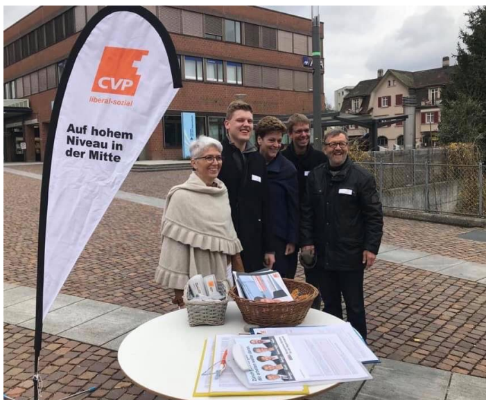
Wahlkampf mit Inhalt: Unterschriftensammlung für die Gesundheitsinitiative "Kostenbremse im Gesundheitswesen"

Beim Schreiben dieser Zeilen am 1. April freue ich mich zu erfahren, dass die CVP Baselland,